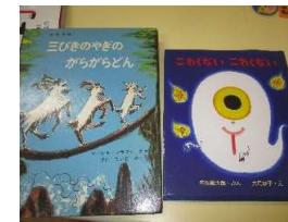
がらがらどん・こわくないこわくない リクエストの多い一冊