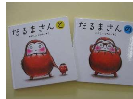
だるまさんシリーズ 0・1歳にお勧めの絵本