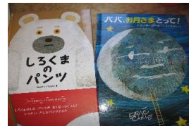
しろくまのパンツイトレ時期に☆ お月様とって 月の満ち欠けが楽しくわかる本