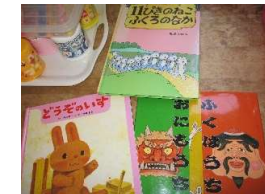
2歳後半～3歳へ ストーリー系の本